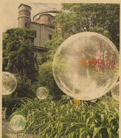
Natural Capital, via Fratelli Gebba 10 All'Orto Botanico di Brera l'installazione di Eni firmata da Carlo Ratti Associati, Italo Rota e Alessio Fini, con la rivista Interni: bolle fluttuanti visualizzano in 3D la quantità di CO2 immagazzinata da diverse specie di alberi e mostrano i rischi della deforestazione.