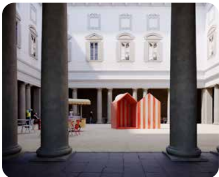
Palazzo Lita. Mosca Partners presentaron Design Variations 2021 en el histórico palazzo , que transformó su patio en una playa. El estudio portugués Aires Mateus idearon la instalación Una playa en el Barroco . Pensada para celebrar el encuentro de las personas.

EL DISEÑO HA VUELTO A MILÁN. DEL 4 AL 10 DE SEPTIEMBRE EL 'FUORISALONE' -JUNTO CON EL EVENTO DEL SALONE DEL MOBILE, 'SUPERSALONE', Y LA MILAN DESIGN WEEK- HA VESTIDO DE BRILLO Y ESPERANZA A SU CAPITAL MUNDIAL. DISTRITOS, PATIOS, PALACIOS, MUSEOS, 'SHOWROOMS', HOTELES... TODOS ABRIERON SUS PUERTAS A LO MÁS TOP Y ULTIMÍSIMO