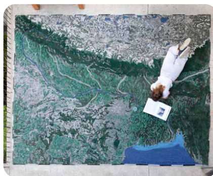
Álvaro Catalán de Ocón. El Ganges via Satélite es la alfombra-mapa de la colección Rivers Plastic hecha a mano en plástico PET. Un proyecto de ACdO para Gan Rugs. Finalista del premio Ro Plastic Prize 2021 , de la galerista de Rossana Orlandi.