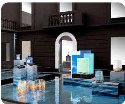
Artemest. La exposición AQVA aglutinó, en el Senato Hotel , piezas de artesanos italianos inspiradas en el agua. El proyecto, de los arquitectos Ciarmoli Queda Studio, para Artemest, nació del deseo de celebrar la importancia del agua como fuente de vida y energía.